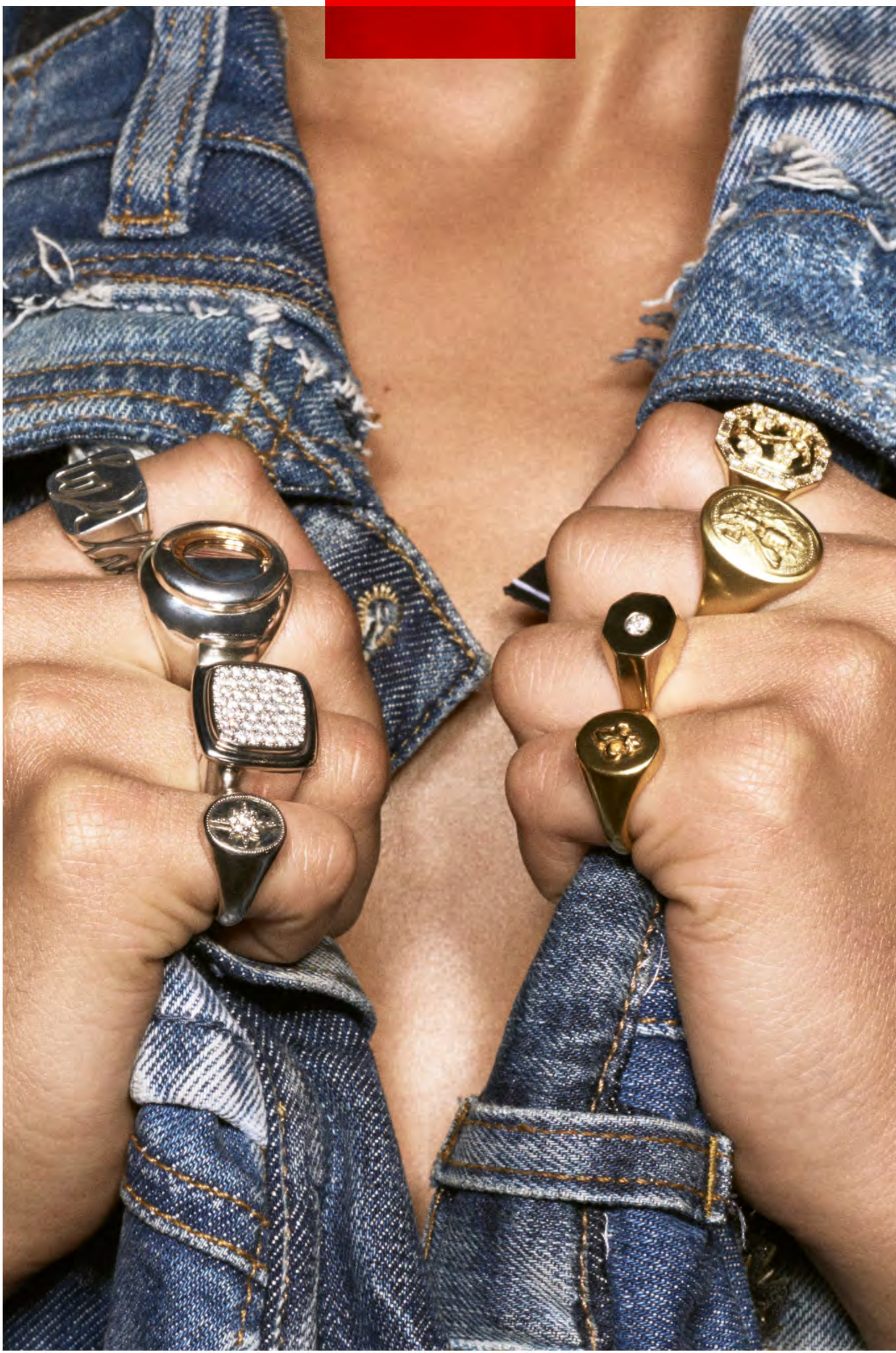
Réalisation : Claire Dhelens